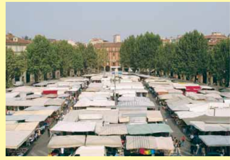
Platani di piazza Alfieri nel salotto cittadino dal 1932