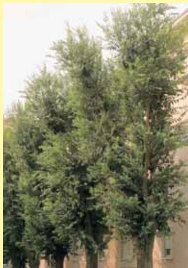
Bagolari di via Dogliotti (area corso Cavallotti) da sempre dormitorio per gli storni