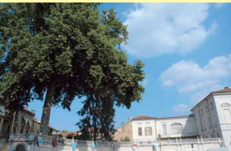
Platano di Palazzo Alfieri piantato nel 1849 per i cento anni della nascita di Vittorio Alfieri