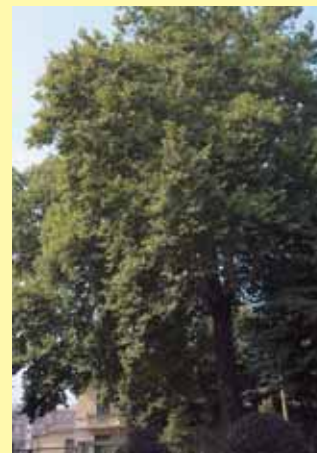
Platano del circolo Way-Assauto (via Pietro Chiesa 20) patriarca della natura con oltre 200 anni