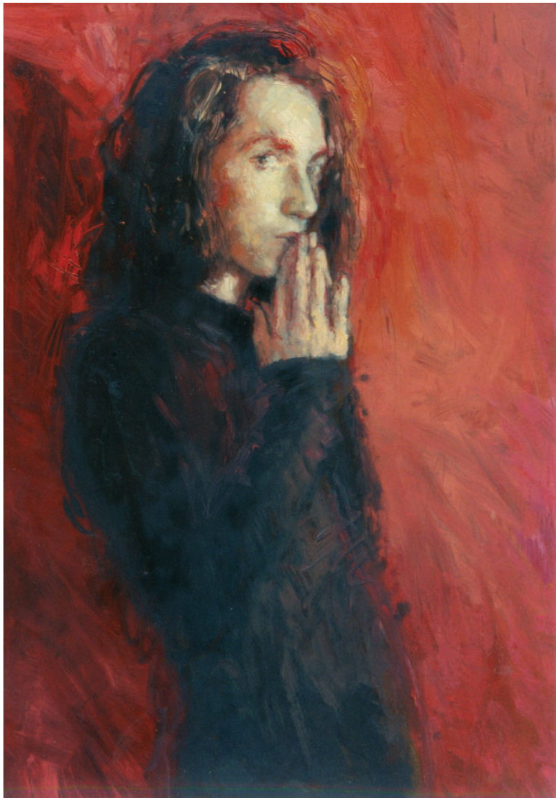
Sciamano - Olio su tavola, 70 x 100, 2004