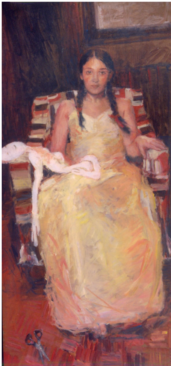
Autoritratto con le trecce - Acrilico su tavola, 90 x 180, 2005

Ha partecipato a mostre personali e collettive in gallerie d'arte private e pubbliche –Galleria Magenta 52 - Vercate - Galleria Wunderkammer - Castello di Rivara - Galleria d'Arte Moderna di Piombino e Museo d'arte Contemporanea di Settimo Torinese. Vincitrice di riconoscimenti in vari premi e segnalazione al Premio Italian Factory 2004.