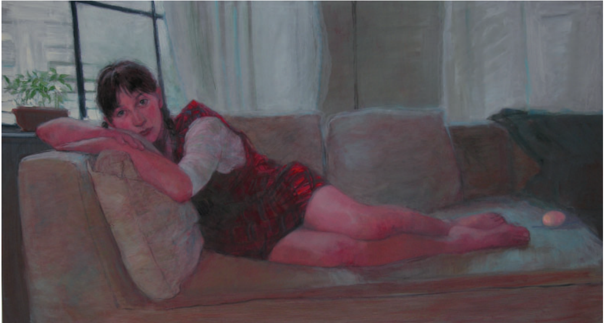
Dentro l'uovo - omaggio a Balthus - Acrilico su tavola 100 x 180, 2005