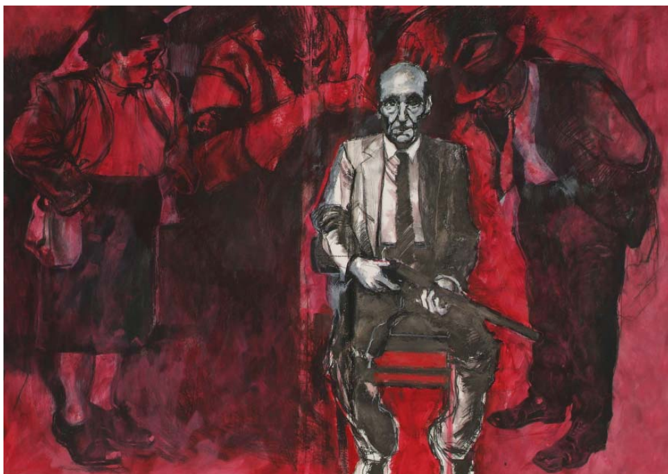
“Le persecuzioni reali o presunte di William S. Burroughs” , 2004, pastello china e lacca rossa su carta , cm 240X300.