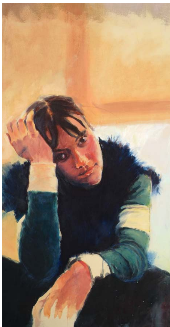
"Pensiero" , 2004, olio su tela, cm 148X78.

É residente a Torino, in Via Volvera n° 17. Atelier presso lo studio di Via Rubiana, 12 Torino