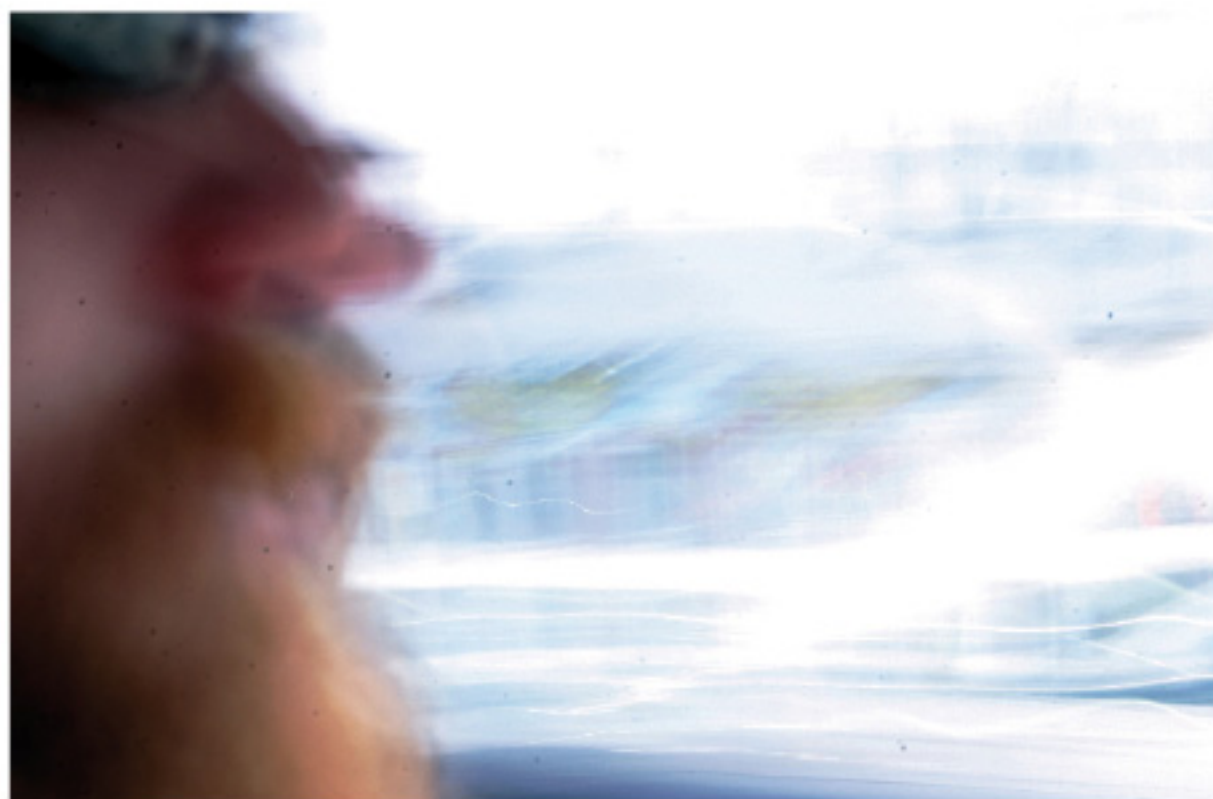
Marco Mundo - fotografie - Viaggio