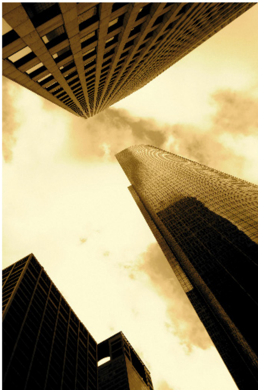
Marco Mundo - fotografie - Terra 2

Lavora come fotografo professionista. Questa è la sua prima esposizione personale.