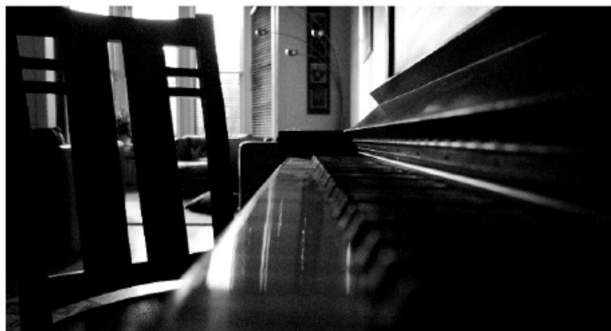
Marco Mundo - fotografie - Rifugio 2